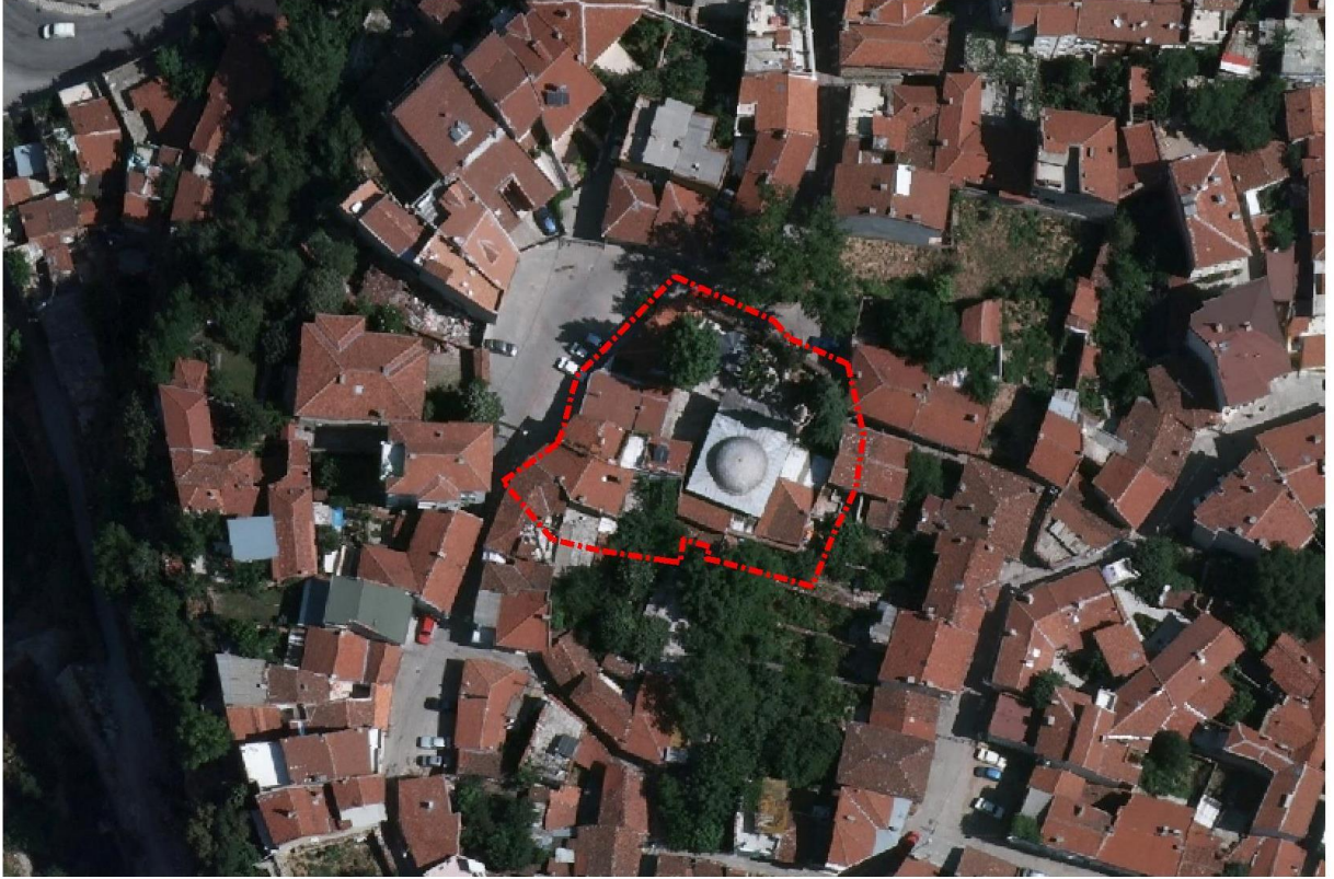
Resim 1: Alana ilişkin uydu görüntüsü

Plan değişikliğine konu alan yaklaşık 225 m 2 olup, parseller özel mülkiyetinden oluşmaktadır. Söz konusu alan Osmangazi İlçesi, Alaaddin Mahallesinde, Ali Osman Sönmez Onkoloji Devlet Hastanesinin 385 mt. güney batısında, Tophane Endüstri Meslek Lisesinin 345 mt. güney doğusunda, Alaaddin Camii Caddesinde yer almaktadır.